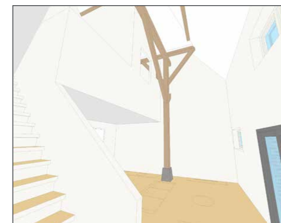
► Zichtpunt (schematisch) niet op schaal